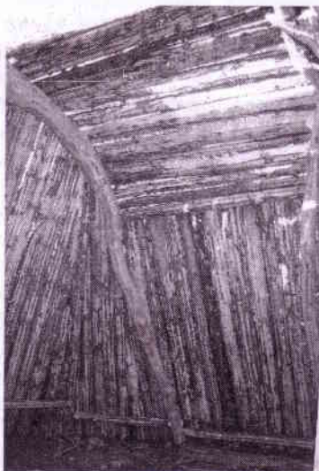
Hamsungamme: Gammens innervegg består av rundstokker lagt på reisverket. På yttersiden stables det torv på hverandre for iso-lering. Musen "Madame" var tilstede da bildet ble tatt.

På Hansbakk i Hamarøy bygger elever fra Hamarøy sentralskole en gamle nettopp der hvor Hamsun bodde sommeren 1900 og skrev Munken Vendt . Hamsun hadde kommet hjem for første gang etter mer enn 20 år. Først hadde han prøvd å bo hos foreldrene i Hamsund, men det ble for trangt. Hamsun flyttet til gården Hansbakk for å få bedre plass og mer arbeidsro. - Tomten er lokalisert ved hjelp av lokalkjente. "Gjennom funn