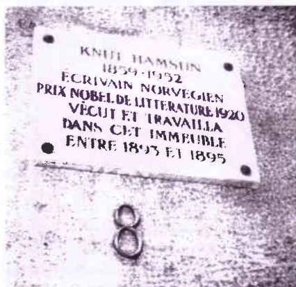
Rue Vaugirard nr. 8 i Paris, ikke langt fra Sorbonne: Her skrev Hamsun "Pan".